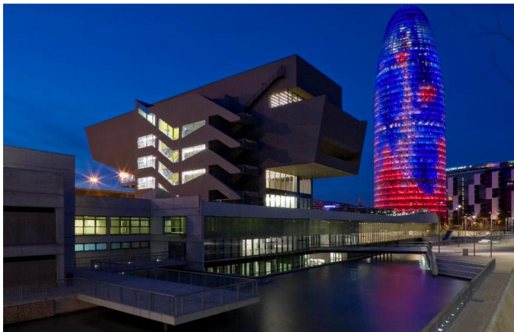
the Disseny Hub Barcelona (DHub)